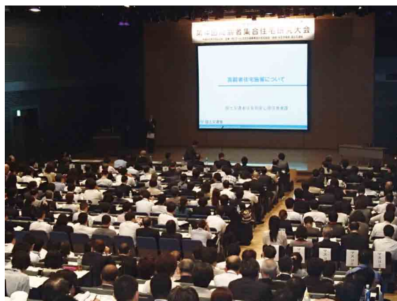
第4回のサ住協研究会の様子