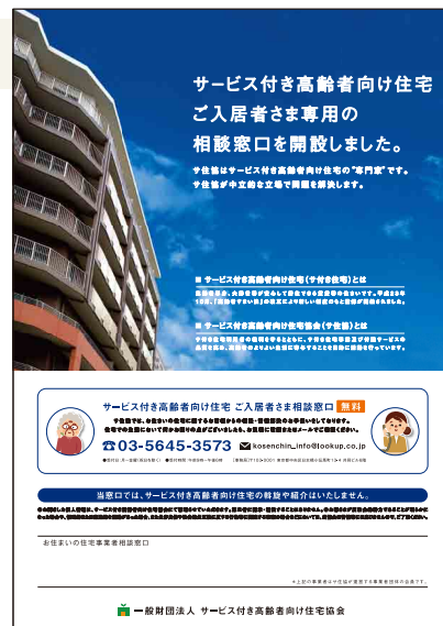
ポスターイメージ